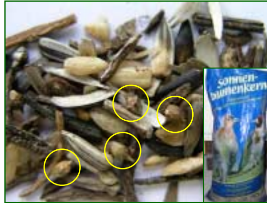
Samen von Ambrosia artemisiifolia als Verunreinigung in Sonnenblumen-

Die Beifußblättrige Ambrosie wurde schon 1863 in Deutschland beschrieben. Die Pflanze konnte sich aber nicht sehr stark ausbreiten, da ihre Samen nur selten reif wurden. In letzter Zeit gelangten aber immer wieder in lang andauernden und zu warmen Herbstern die Ambrosia-Pflanzen zur Samenreife. Die Samen sind im Gegensatz zur Pflanze frostbeständig. Pro Pflanze werden ca. 1 000 bis 4 000 Samen gebildet.