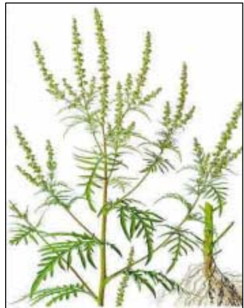
Ambrosia artemisiifolia ( www.margheritabusto.it/ambrosia.htm )

Die Beifußblättrige Ambrosie ist eine einjährige, krautige Pflanze aus der Familie der Korbblütler. An den Boden stellt sie keine besonderen Ansprüche und wächst bevorzugt auf Nichtkulturland. Die Form ihrer Blätter erinnert an die Beifuß-Pflanze ( Artemisia vulgaris ); daher auch der Name. Auch Größe und Habitus stimmen mit dem Beifuß ungefähr überein. Einige Unterschiede gibt es aber doch: Beim Beifuß ist die Blattunterseite heller (weißlich fein behaart) als die Blattoberseite. Zerriebene Beifußblätter riechen würzig.