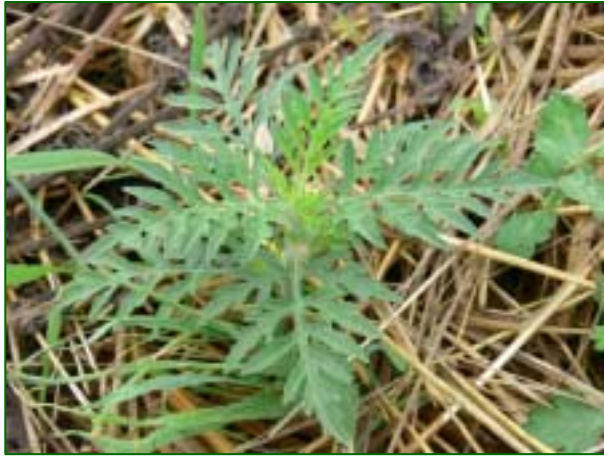
Jungpflanze auf abgeerntetem Getreidefeld

Die Bekämpfung Beifußblättrigen Ambrosie erfordert große Sorgfalt, da diese Pflanze äußerst zählebzig ist. Die Verhinderung einer weiteren Ausbreitung und die Ausrottung von Beständen muss Ziel aller Bekämpfungsaktionen sein.