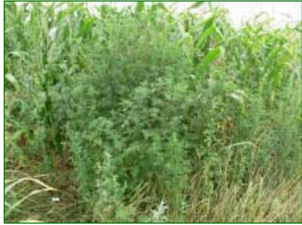
Pflanzen kurz vor der Blüte im August am Rand eines Maisfeldes

Ein häufiger Fundort im Siedlungsbereich sind die Stellen, an denen Vögel gefüttert werden. In diesem Bereich (Haus- und Kleingarten) ist es am günstigsten, die Pflanzen möglichst zeitig, noch vor der Blüte, komplett auszureißen und über den Hausmüll zu entsorgen. Erfolgt eine Entsorgung über den Kompost, muss sichergestellt sein, dass nicht noch eine Notblüte stattfindet und so noch Samen entstehen können. Werden die Pflanzen nur an Ort und Stelle liegengelassen, ist bei ausreichender Bodenfeuchtigkeit mit einer Wiederbewurzelung zu rechnen.