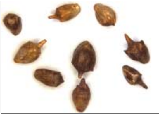
Samen von Ambrosia artemisiifolia