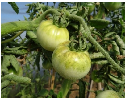
Abbildung 1: Symptombild des ToBRFV an Tomaten

Das Tomato brown rugose fruit virus (ToBRFV), auch als „Jordan Virus“ benannt, wurde Ende August 2020 erstmals in Brandenburg in einem Bestand von Tomatenpflanzen zur Fruchterzeugung festgestellt.