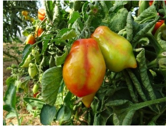
Abbildung 3: Symptombild des ToBRFV an Tomaten