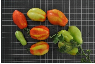
Abbildung 2: Symptombild des ToBRFV an Früchten der Tomate