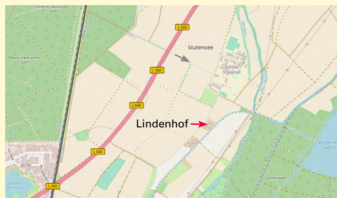
Karte erstellt aus OpenStreetMap-Daten, Lizenz: Creative Commons BY-SA 2.0

Demonstrationsbetrieb integrierter Pflanzenschutz im Ackerbau Lindenhof 76297 Stutensee