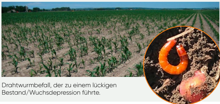
Drahtwurmbefall, der zu einem lückigen Bestand/Wuchsdepression führte.

Bei dem als Drahtwurm bekannten Schädling handelt es sich um Larven verschiedener Schnellkäferarten, die durch ihren Fraß an unterirdischen Pflanzenteilen (Saatkorn, Wurzeln, Knollen) ein vielfältiges Schadbild verursachen können. Im Mais kommt es zu Verfärbung und Absterben einzelner Blätter und Wuchsverzögerungen bis hin zum Totalausfall einzelner Jungpflanzen. Hingegen ist bei der Kartoffel die Beschädigung der Knollen das Hauptproblem. Durch Fraß von Tunnellöchern können die Kartoffeln nicht mehr vermarktet werden.