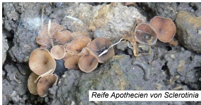
Reife Apothecien von Sclerotinia