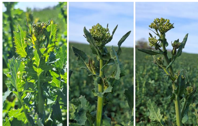
BBCH-Entwicklungsstadien (Raps) vlnr: 52 - 55 - 57

Eine wichtige Entscheidungshilfe bietet das Prognosemodell SkleroPro . Für die schlagspezifische Berechnung der Behandlungsentscheidung müssen mehrere Angaben gemacht werden. Mit der Lage des Schlages werden die ortsgenauen Wetterdaten genutzt. Die Berechnung beginnt, wenn 50 % der Pflanzen das BBCH-Stadium 55 – Einzelblüten der Hauptinfloreszenz sichtbar (geschlossen) – erreicht haben. Weiterhin ist es wichtig, wann zuletzt eine Sclerotinia -anfällige Kultur in der Fruchtfolge angebaut wurde. Dazu zählen Sonnenblumen, Kartoffeln, Leguminosen und Kreuzblütler wie Senf, Kohl oder Raps. Mit diesen Angaben wird die ökologische Behandlungsschwelle berechnet. Um eine ökonomische Schadschwelle ermitteln zu können, müssen die Kosten für das Fungizid und die Ausbringung sowie die Ertrags- und Preiserwartung angegeben werden. Wurde ein Sklerotien-Depot angelegt, kann dies einen Hinweis zur Infektionswahrscheinlichkeit geben. Erscheinen keine becherförmigen Fruchtkörper (Apothecien), ist eine Infektion eher unwahrscheinlich.