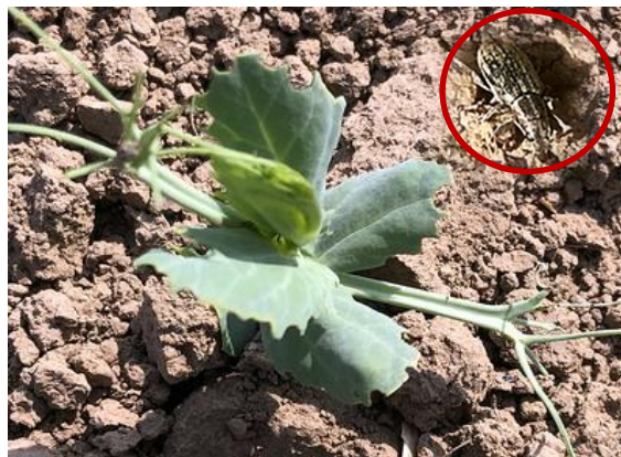
Fraßschaden durch Blattrandkäfer in Futtererbsen und Käfer oben rechts

Futtererbsen und Ackerbohnen sind verbreitet aufgelaufen. In dieser Phase ist auf die Schädigung durch die Blattrandkäfer zu achten. Der bis zu 5 mm lange Rüsselkäfer mit dunkler Färbung und hellgrauer, streifenförmiger Beschupung ist auf dem Boden kaum zu erkennen. Allerdings lässt sich der typische Fraßschaden der Käfer (bogenförmiger Fraß am Blattrand) leicht diesem Schädling zuordnen. Später können die im Boden lebenden Larven die Seitenwurzeln und Knöllchen zerstören und in der Folge zu Stickstoffmangel und verzögertem Wachstum führen. Kontrollen in den Leguminosen hinsichtlich Fraßschäden werden bis zum Erreichen des 6-Blattstadiums angeraten, um die Etablierung der Bestände zu sichern!