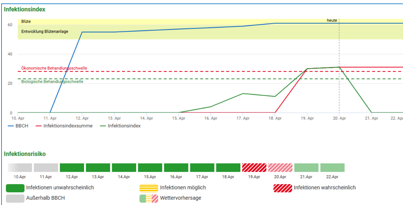
Infektionsindex nach SkleroPro für den Standort Dornburg

Winterrapsbestände stehen kurz vor der Blüte, vereinzelt sind die ersten Blüten geöffnet (BBCH 60). Ab der Blüte besteht die Gefahr einer Infektion mit Sclerotinia sclerotiorum , dem Erreger der Weißstängeligkeit. Optimale Infektionsbedingungen bieten Temperaturen von 10 – 15 °C und langanhaltende Feuchtigkeit durch Regen oder Tau, vor allem wenn die ersten Blütenblätter abfallen (BBCH 67) und sich in den Blattachseln festsetzen. Ein Fungizideinsatz ist möglich, aber nicht immer notwendig. Darüber hinaus zeigen mehrjährige Versuchsergebnisse, dass Fungizidbehandlungen zur Blüte oftmals nur geringe Ertragssteigerungen bewirken, die nicht kostendeckend sind. Besonders vor dem Hintergrund der aktuellen Dieselpreise sollte die Behandlung hinterfragt werden. Sollte das Prognosemodell SkleroPro auslösen (siehe Standort Dornburg), kann die Behandlung ab BBCH 61 stattfinden.