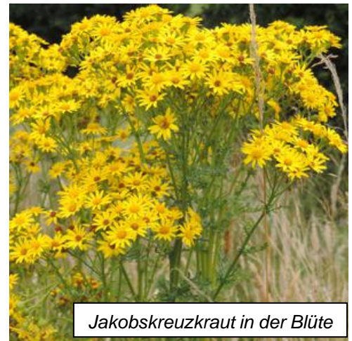
Jakobskreuzkraut in der Blüte

Das Jakobskreuzkraut erreicht eine Wuchshöhe von 30 bis 100 cm und blüht von Juni bis September. Diese zweijährige Giftpflanze hat sich an Wiesenrändern und auf extensiv bewirtschafteten Grünlandflächen etabliert. Um eine Ausbreitung der Pflanze zu verhindern, sollte die Blüte und Samenbildung verhindert werden. Dies gelingt nur mit aufwändiger Handarbeit, am besten durch das rechtzeitige Herausreißen oder noch besser durch das Ausstechen der Pflanzen. Nach Abmähen oder Mulchen kann es zu einem Wiederaustrieb der Pflanzen kommen. Die Pflanzen sollten auch nicht auf der Fläche verbleiben und nicht auf den Kompost gelangen. Bestimmte Alkaloide, besonders angereichert in den jüngsten Blättern und Blüten, verursachen die Toxizität der Pflanze. Diese Giftstoffe werden bei der Trocknung und Silierung nicht abgebaut, so dass auch die Verfütterung von Heu und Silage an Pferde und Rinder zu starken gesundheitlichen Schäden führen kann.